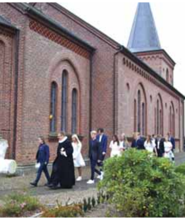
I 2020 blev konfirmanderne udsat af myndighederne. I Dalby betød det efterårskonfirmation sidst i september. Men en festlig og højtidelig dag blev det. Her er konfirmanderne på vej rundt om kirken efter konfirmationen og ind ad bagvejen til den efterfølgende fotografering.