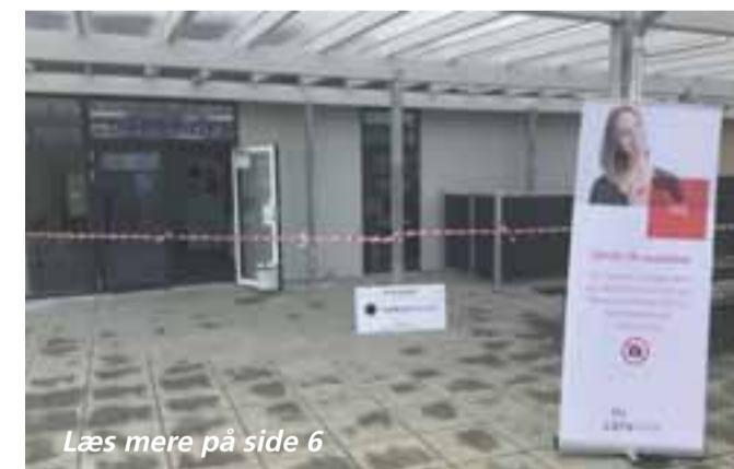
Læs mere på side 6

opfordre alle i Kolding by til at lade sig teste. I Dalby GF's klublokaler bliver der lavet kviktest (næsepodning), og der er åbnet mellem klokken 9.00 og 17.00.