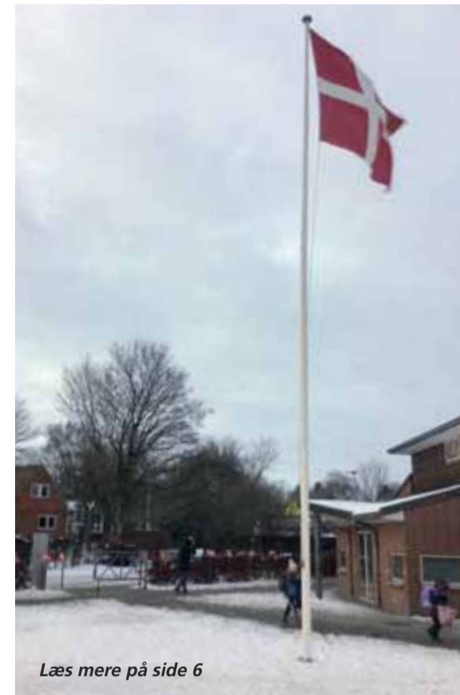
Læs mere på side 6

Det er et frivilligt tilbud, og det er en kommunal medarbejder, der kommer og tester personalet.