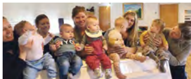
Babyrytmik foregår i Dalby Præstegård, Gl. Tved 23A

Det er gratis at deltage, men tilmelding er nødvendig med