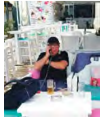
Ferieramt manager på intensivt arbejde for at lukke de sidste kontrakter inden sæsonstarten.