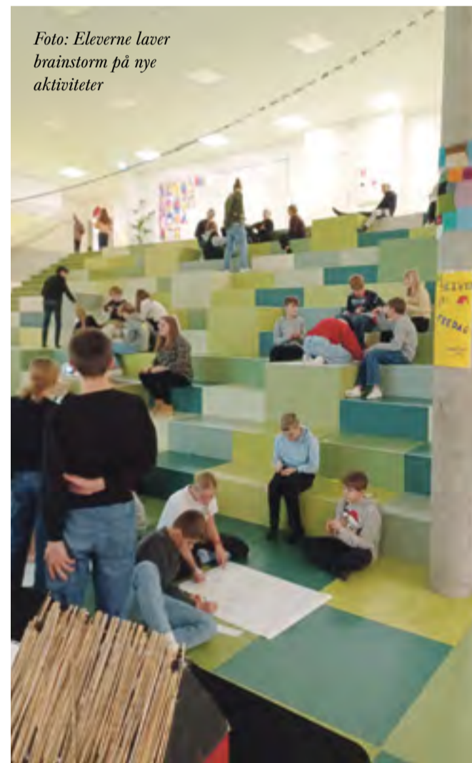
Foto: Eleverne laver brainstorm på nye aktiviteter

Herefter vil vi lave en film-aften hver måned på Dalby Skole.