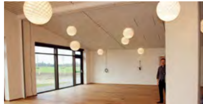
Den store sal kan deles i to med en lydfast rumdelel.

med, at kontorerne indtages, og korsangerne begynder.