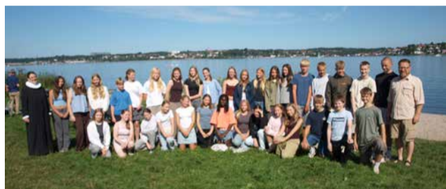
I fjor fik 33 konfirmander deres første "kryds" ved strandgudstjenesten.