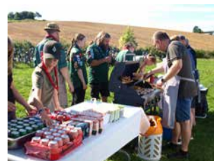
Ingen strandgudstjeneste uden grillpølser.

Der er ikke stole til alle, så det er vigtigt, at flest muligt medbringer klapstole og tæpper til at sidde på.