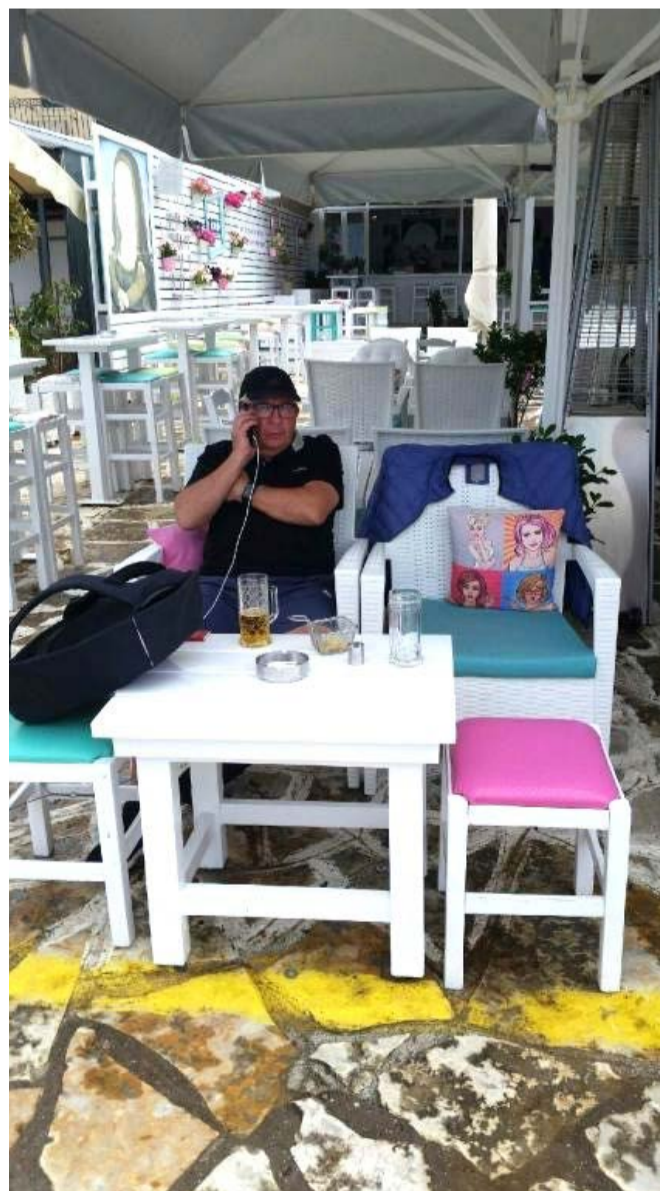
Skrubenten i en aktiv stund i det sydlandske for at skrive kontrakter til kommende sæsoner.