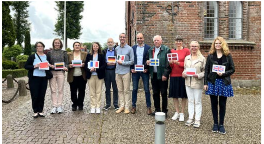
I fjor blev Pinseberetningen læst på hele 11 sprog i Dalby Kirke.

Interesserede læsere kan melde sig til sognepræsten med sit sprog på 75 50 23 27 eller jcbi@km.dk