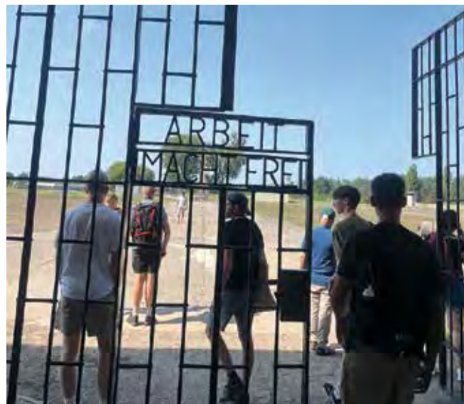
Eleverne – i 28 grader – i koncentrationslejren Sachsenhausen.