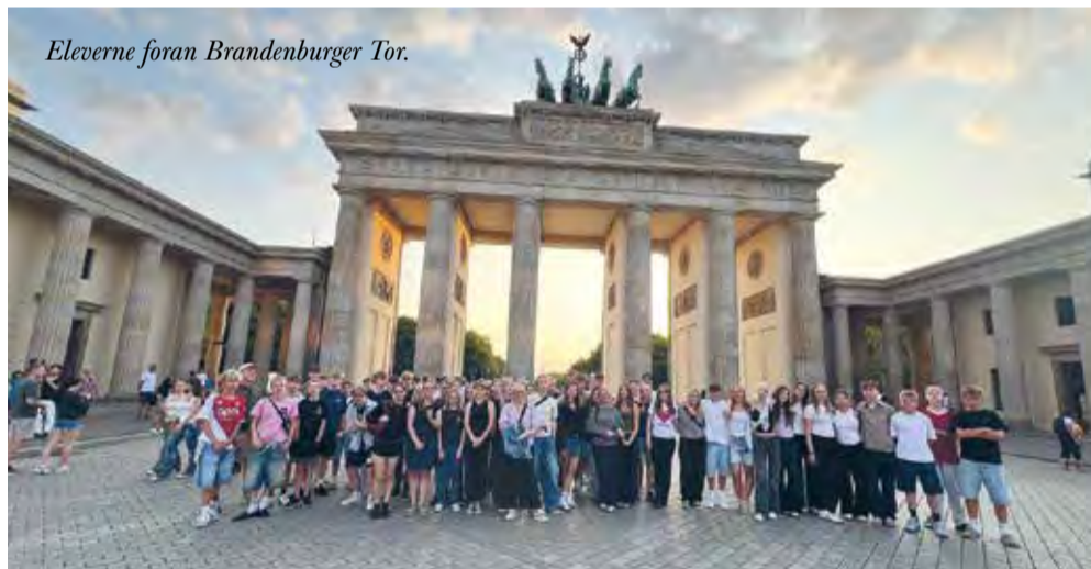
Eleverne foran Brandenburger Tor.

Jeg er utrolig glad for at have fået lov til at være med på denne skolerejse. Selvom jeg normalt ikke underviser, har jeg fået fornøjelsen af at varetage danskundervisningen i 9.C frem til efterårsferien. Det har været en fantastisk oplevelse at være med på turen og se, hvordan eleverne engagerer sig i både de historiske oplevelser og fællesskabet.