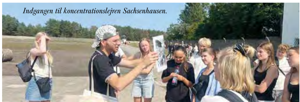
Indgangen til koncentrationslejren Sachsenhausen.