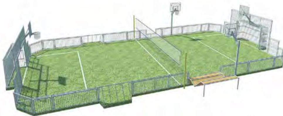
Billedet af multibanen er kun et udkast. Banen er uden bæk, volleynet og basketballbane.

Multibanen kommer også Dalby GF til gavn, da fodboldklubben kan træne de små spillere på den.