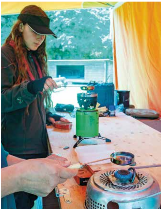
Spejderne lavede flotte lejrmarker ved at smelte tin over trangia.