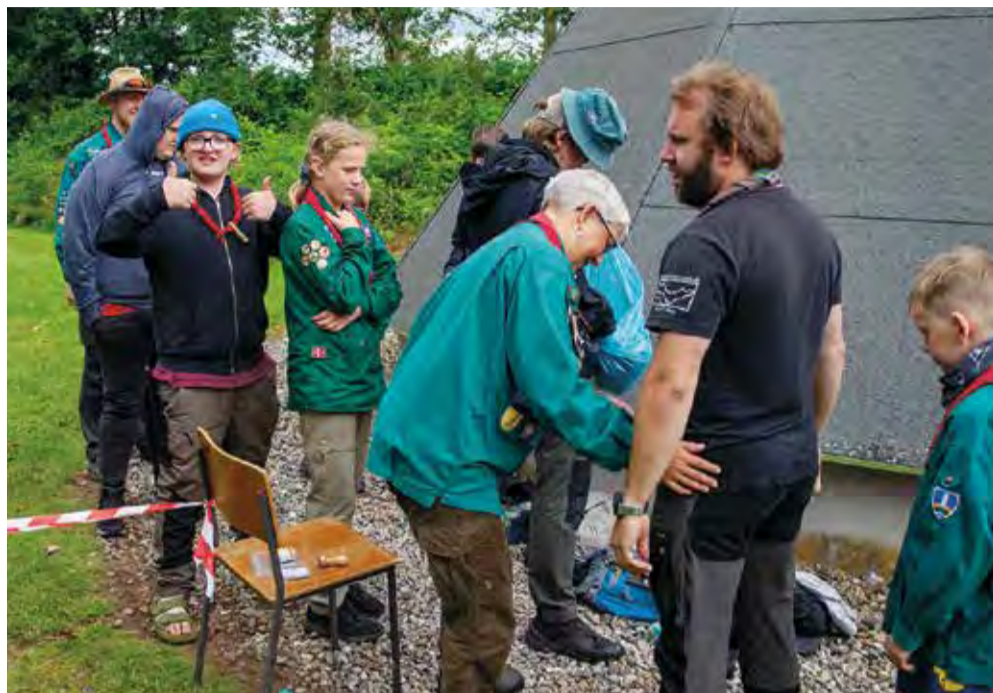
Opfindsomme smuglere forsøgte at smugle deres gods forbi grænsevagterne.

Vi brugte det meste af dagen på at pakke lejren sammen og lave forberedelser, for der skal noget til at bispise 60 personer. Alle blev mætte og fik sig et godt grin til lejrball. Det viste sig nemlig, at en af bæverne har talent for at underholde, hvilket desvær-