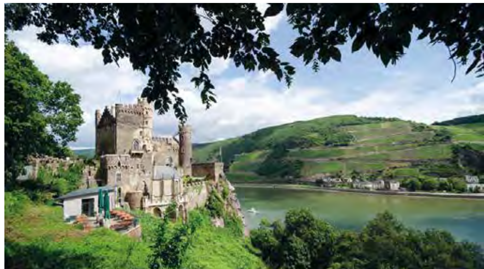
Sejltur på Rhinen til Burg Rheinstein.