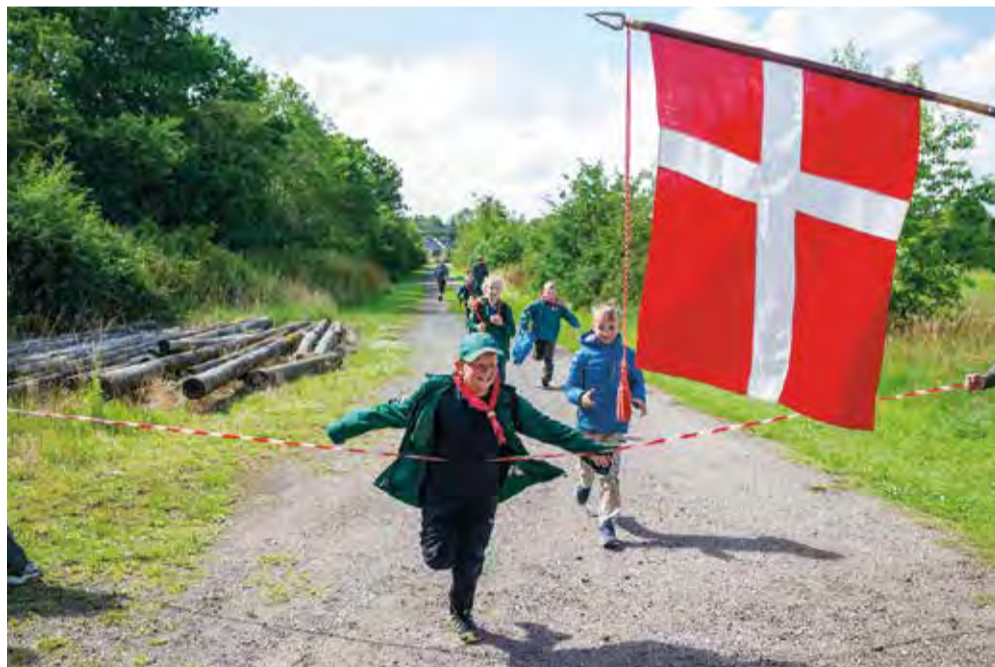
Jaaaa! I mål efter en lang og uforglemmelig hike i højt humør.

os på Nicolai Plads til Kolding Kulturnat fredag den 30. august kl. 16-20. Kig forbi til en snak om, hvad spejder er for os, og om spejder kunne være noget for dig?