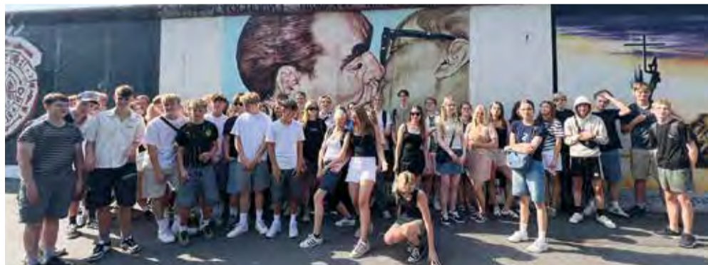
Eleverne foran ”Dødskysset”/Eastside Gallery.