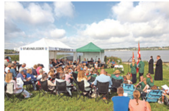
135 dukkede op til årets strandgudstjeneste på Rebæk Strand, heriblandt KFUM-spejderne fra Mariemunde og rigtig mange nye konfirmander