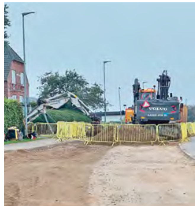
Som alle i området vil vide, er vejarbejdet på Idyl, flyttet fra strækningen neden for Gl. Tved til oven for Gl. Tved. Resultatet er, at Idyl fortsat er spærret og forventes at være det indtil uge 42.

Senere kommer der også vejarbejde på Skamlingvejen, men det skulle efter sigende ikke for alvor blive sat i gang, før Idyl er genåbnet for gennemkørsel.