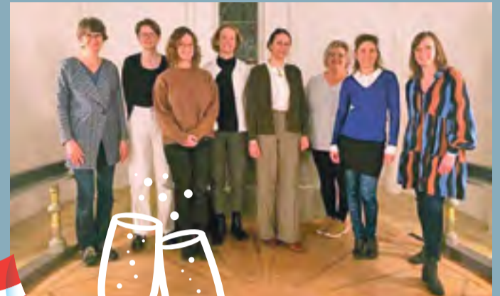
Dalby Kirkes kvindekor medvirker ved jubilæumsgudstjenesten 12. oktober 2023 kl. 19.

Efter gudstjenesten inviterer menighedsrådet på bobler og kransekage. Alle er velkomne.