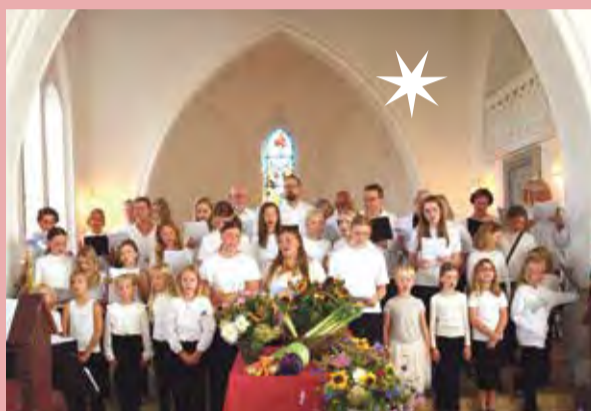
Børnekor, ungdomskor og voksenkor foran hostbord.

år", "Blomstre som en rosenengård" og "Tak og ære være Gud", så vi rigtig kan mærke, det er blevet advent. I mange år har der været en særlig familiegudstjeneste i Dalby Kirke 1. søndag i advent. I år bliver det en mere traditionel, stemningsfuld adventsgudstjeneste. Alle er naturligvis som altid velkomne.