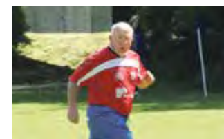
Den tidligere så ensomme manager ses her i et karakteristisk billede fra fotografiets spæde barndom.

Mod normal kutyme blev SOB-afslutningsfesten afholdt fredag før sidste kamp. Noget, som efterlod markante rynker i managerens pande. Ville alle sobbere overhovedet være kommet hjem til mandagskampen? Det var de som tidligere nævnt. The great SOB-party fandt sted på 8'eren i Jernbanegade. Det meget aktive og sympatiske personale lod ingen ganer blive tørre, og en god portion "stegt flæsk og persillesovs" blev skyllet ned på behørig vis, og der blev konkurreret intensivt ved pool-borde, bordfodbold og dart, så det var en fornøjelse. Men det, som særlig varmer mit gamle managerhjerter, er den glæde og fornøjelse, som vi har ved at være i hinandens selskab. Et stærkt