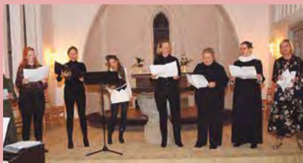
Kirkens kvindekore ved 150 års fødselsdagsgudstjenesten i oktober.

Julekoncert i Dalby Kirke torsdag 7. december kl. 18.30