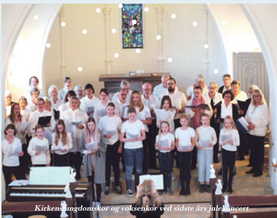
Kirkens ungdomskor og voksenkor ved sidste års julekoncert