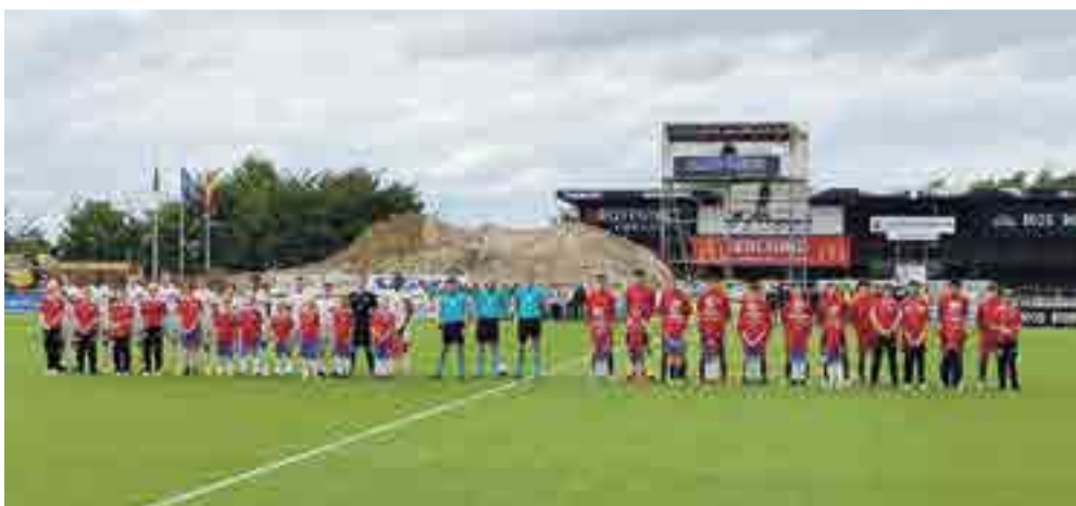
Her ses de to U16-landshold: Belgien til venstre og Portugal til højre – med alle Dalby-spillerne foran.