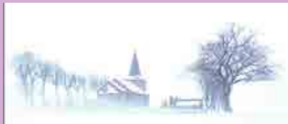
Vinter 2012-13.

Festgudstjeneste nytårsaften. Kor medvirker.