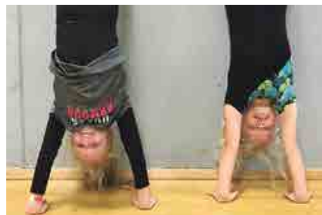
Det kræver styrke og balance at stå på hænder.