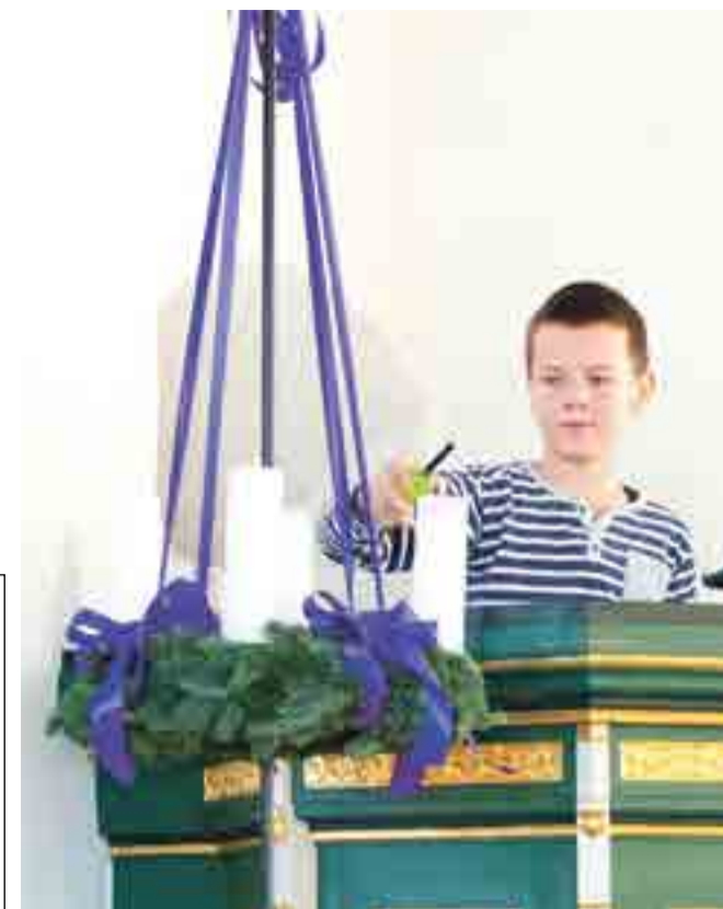
Billederne er fra 1. søndag i advent 2016, hvor det var de nuværende konfirmander, der dengang som mini-konfirmander bar lys ind, og en af dem tændte første lys i adventskransen.