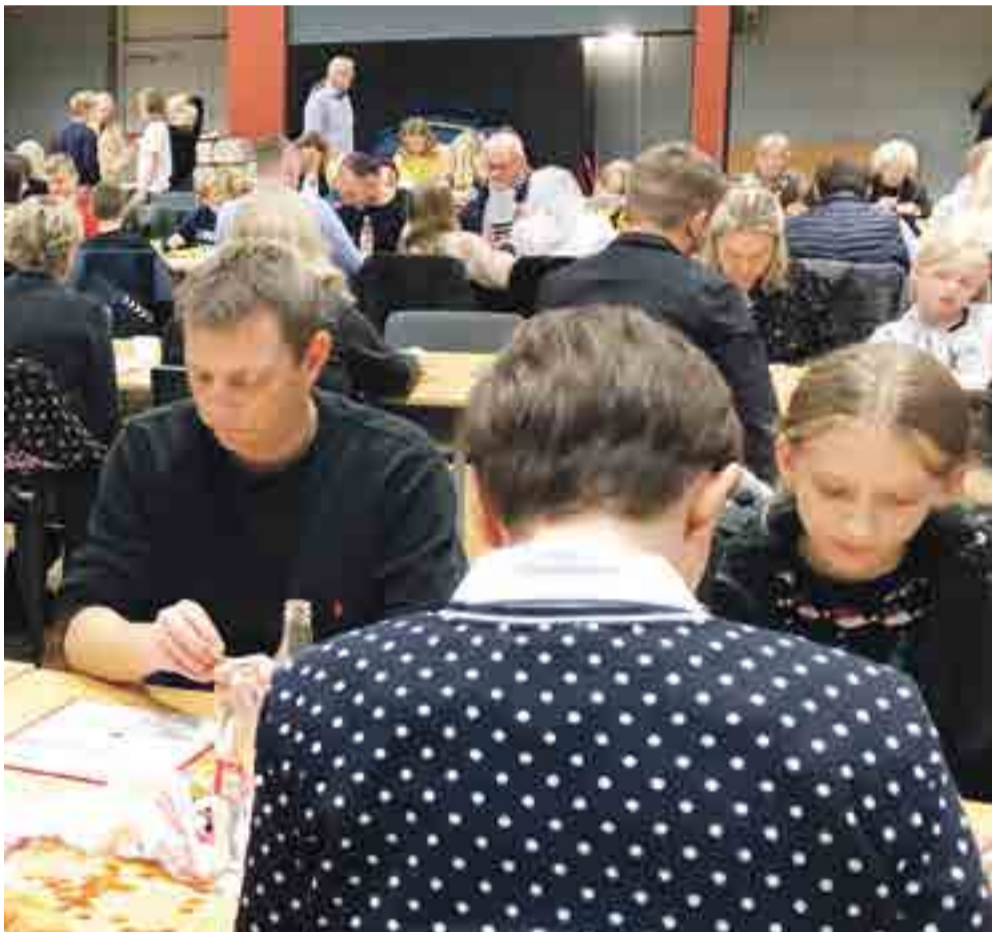
Dalby Banko er hvert år et stort tilløbsstykke. Dørene slås op kl. 17.30 torsdag 25. november. Selve spillet begynder kl. 18.30.