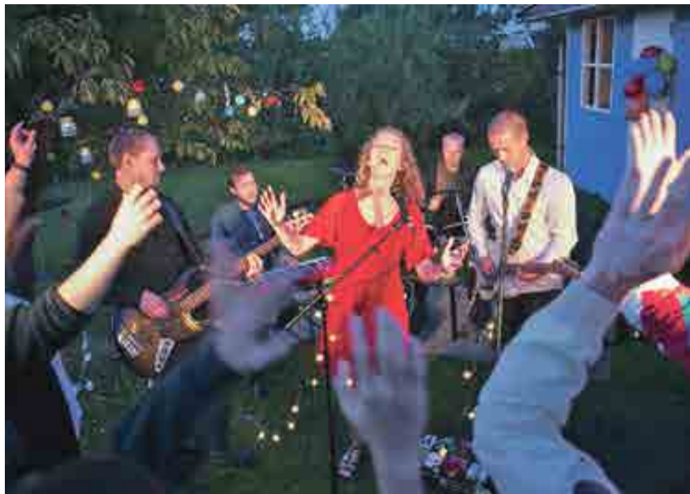
Fredag den 11. marts spiller 4-to-one igen til Dalby GF's vinterfest i hallen.