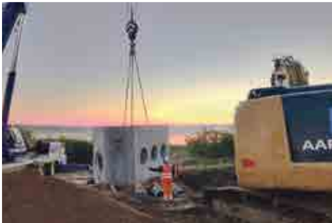
Af BlueKolding Fotos: BlueKolding

BlueKolding er godt i gang med indsatsen for at klimasikre Tved sammen med firmaets entreprenør, Per Aarsleff A/S, som står for gravearbejdet i området. Her fortæller BlueKolding selv om projektet. Billederne i artiklen er fra arbejdet i Tved.