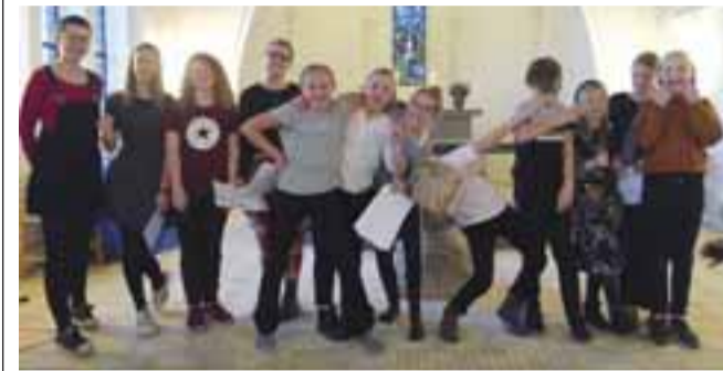
Kirkens ungdomskor laver drama med temaet "fristelser" ved koncerten 19. november kl. 18.30.

Der er gratis adgang til koncerten, som varer ca. en time.