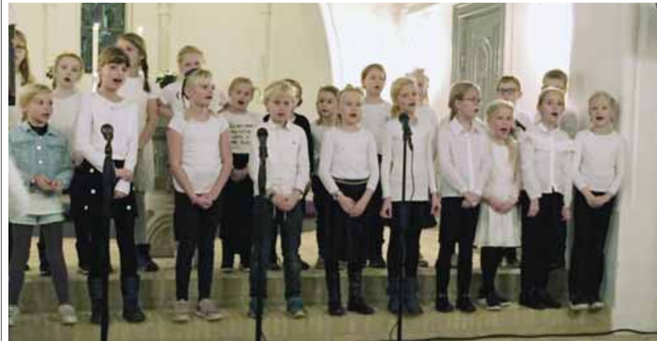
Kirkens børnekor har også tidligere medvirket ved koncerter og gudstjenester. Her er sangerne fotograferet ved en sådan tidligere lejlighed. Nu kan de opleves i Dalby Kirke 1. søndag i advent kl. 13.30.

Der er gratis adgang til koncerten med sangerne i børnekoret, der går i Dalby Skoles yngste klasser.