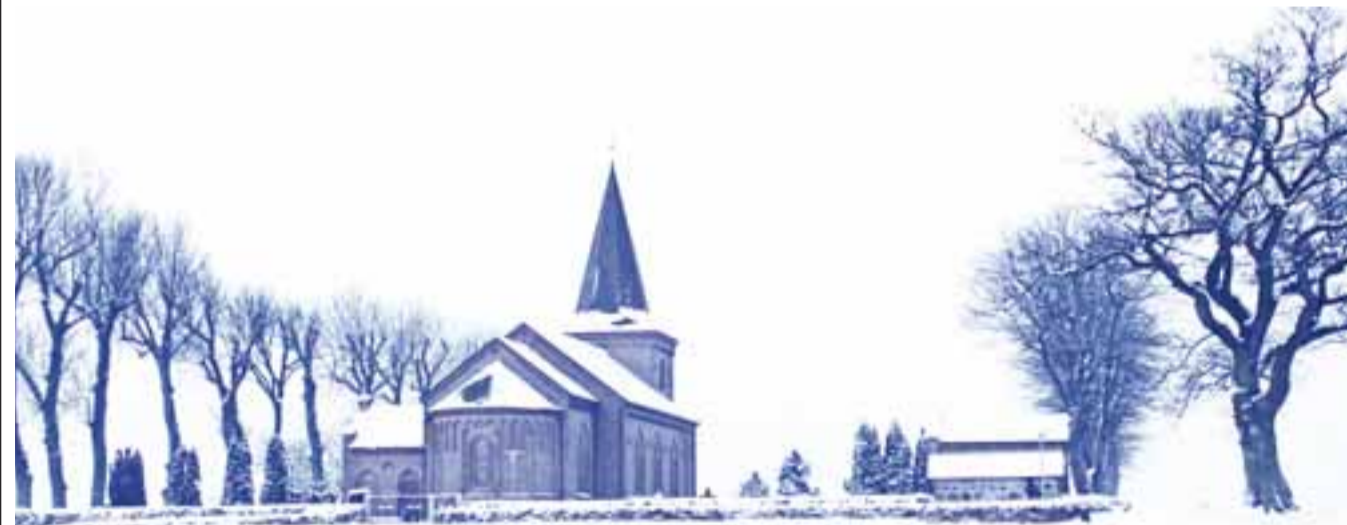
De traditionsrige julegudstjenester i Dalby Kirke bliver i år erstattet af en digital udgave, som menighedsrådet opfordrer alle i Dalby Sogn til at se samtidig for på den måde at skabe et godt nok anderledes fællesskab, men også omfattende endnu flere på én gang.

2. juledag, som de seneste år har budt på "Min yndlingssalme"-gudstjeneste, vil menighedsrådet iværksætte en afstemning til, så folk i sognet kan stemme på, hvilken yndlingssalme man ønsker indsunget af kirkens kor og medarbejdere. Så vil man også her kunne se med på kirkens hjemmeside og synge med på sognets yndlingsjulesalmer. Mere om juleaften og julen i øvrigt i næste nummer af Dalby Tidende.