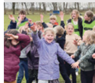
SKOLE Legepatrolje en succes Læs side 10