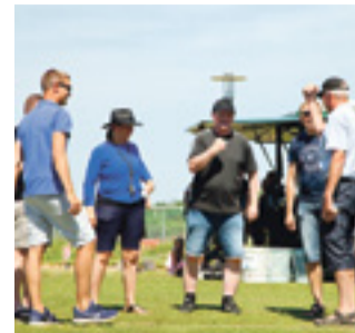
GANG I DIG OG DALBY Alt om Sommerfesten Læs side 2-4

Efter selve ceremonien nød alle deltagerne et glas festlige bobler i den karakteristiske vind.