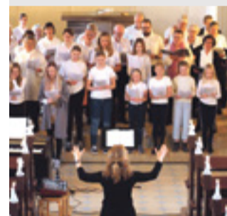
KIRKE Sommerkoncert Læs side 8