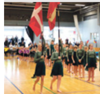
IDRÆT Gymnastikopvisning Læs side 9