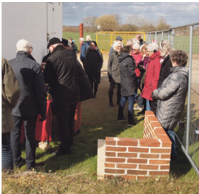
Grundstensnedlæggelsen sluttede festligt af med et glas bobler til alle de glade deltagere, der hyggede sig i læ bag håndværkernes skurvogn.