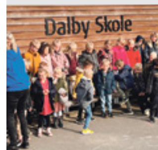
SKOLE 67 Tyvstartere Læs side 11