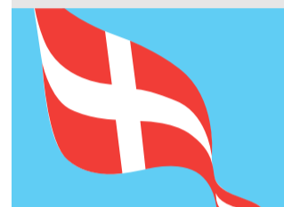
KIRKE Årets konfirmander Læs side 6