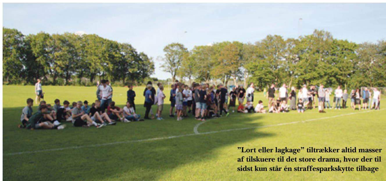
”Lort eller lagkage” tiltrækker altid masser af tilskuere til det store drama, hvor der til sidst kun står én straffesparksskytte tilbage