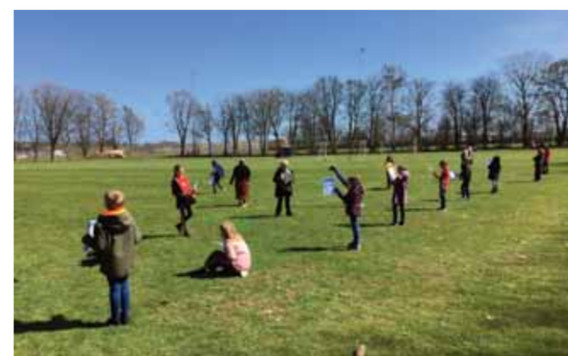
Udeundervisning i en Coronatid: 2C øver gangetabeller på sportspladsen.

før. Sundhedsstyrelsens vejledninger om afstand mellem eleverne, hygiejne- og rengøringsregler, og kravet om at mindst halvdelen af skoledagen sker udenfor betyder, at alle lokaler skulle om-indrettes, og kendte skemaer skulle ændres totalt. Det er lykkedes, men alt kunne ikke starte 15. april.