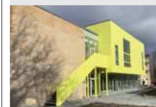
SKOLE Se den flotte skole Læs side 7