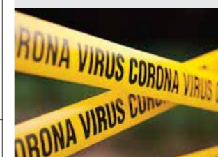
SKOLE Corona hjemmeskole Læs side 6