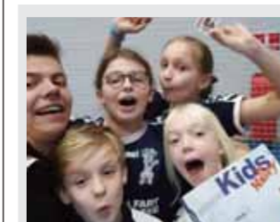
IDRÆT Månedens træner Læs side 2