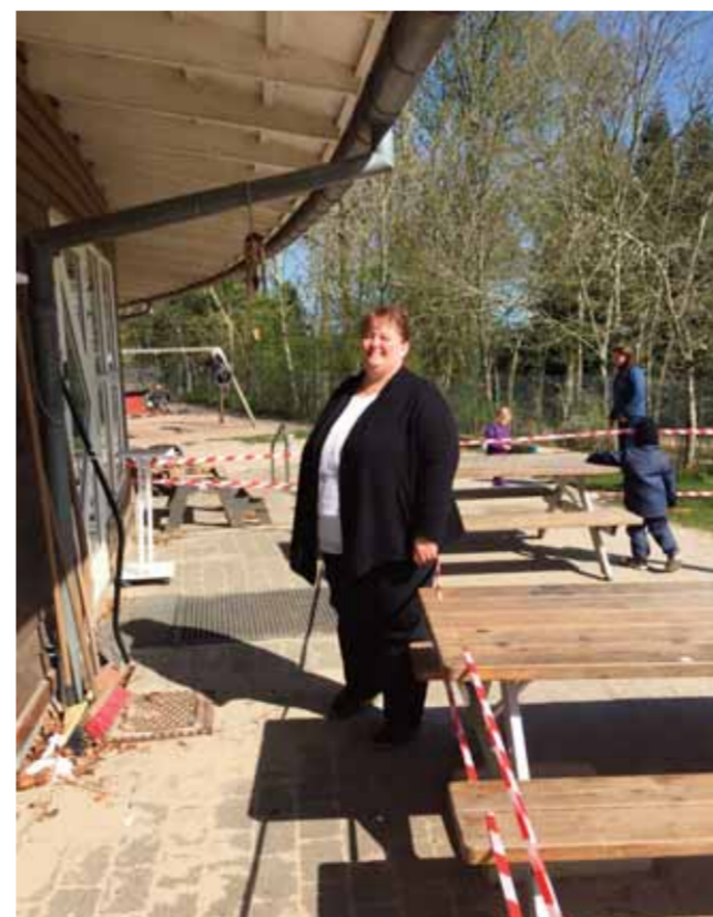
Selv de små børn skal holde afstand i disse Coronatider, så derfor er der sat afmærkningsbånd op på legepladsen, så den bliver inddelt i mindre arealer til mindre grupper af børn.