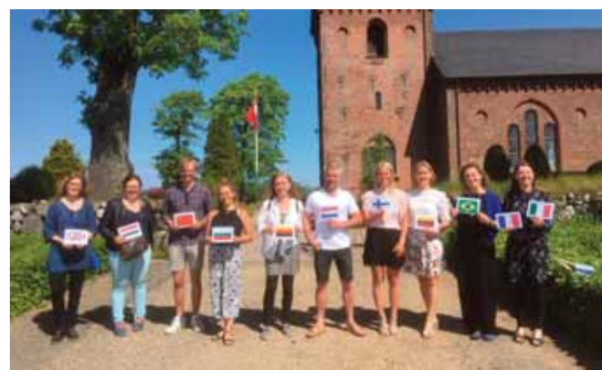
I 2018 lød pinseberetningen på 11 forskellige sprog i Dalby Kirke: Engelsk, ungarsk, kinesisk, bulgarsk, tysk, hollandsk, finsk, litauisk, portugisisk (brasiliansk), fransk og italiensk.

Som rigtig meget andet i denne tid er Dalbys planlagte pinsefejring søndag 31. maj kl. 10.30 også usikker. Men vi håber at gennemføre i en form, der imødekommer myndighedernes anvisninger.