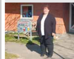
LOKALT Ny leder med kendt ansigt Læs side 8