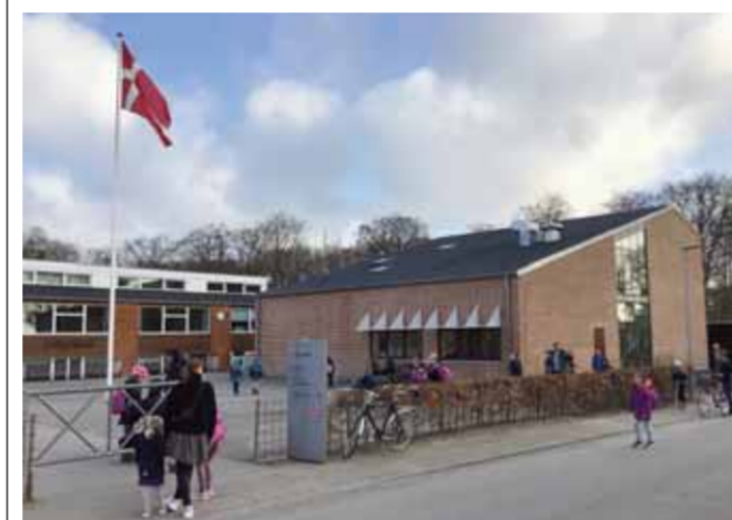
Forældrene må aflevere børn udenfor, hvor de tages imod af lærere og pædagoger.

Klasserne har måttet fordeles i to lokaler for at kunne holde afstand på to meter i undervisningen. Det positive er, at det giver mere ro og voksenhjælp, når vi især i indskolingen har måttet have to voksne på. Vi ser frem til, at 6. klasserne også må komme i skole igen, og prøver at bruge den lidt svære tid til at arbejde på nye måder, der kan lære børnene og os på skolen noget nyt.