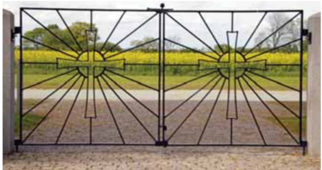
Følg præstens ugentlige hilsen på www.dalbykirke.dk Ofte med udgangspunkt i Dalby Kirkes inventar.

og med 10. maj. Kirkebygningerne er også lukket. Foreløbig har vi en kalender, der begynder efter 10. maj. Om datoen rykkes efter deadline på Dalby Tidende er uvist. Dåb, bryllupper og begravelse har som det eneste kunnet gennemføres, men kun ved overholdelse af særlige retningslinjer, der undervejs er blevet justeret. Nogle dåb er blevet gennemført i Dalby Kirke, andre er blevet udsat. Vielse og begravelser kan naturligvis ikke udsættes på samme måde, men biskopperne har understreget muligheden for at gennemføre kremation og så vente med højtideligheden i kirken – med jordpåkastelse på urnen – til, når samfundet igen åbnes.