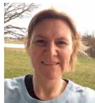
Af Sidse Østergaard

Efter netop at have modtaget information på Aula om den delvise genåbning af Dalby skole for 0.-5. klasserne, er det oplagt at gøre status over perioden med hjemmeskole, som vi har oplevet den herhjemme.