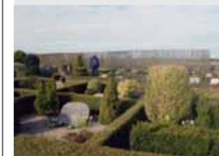
KIRKE Graver takker af Læs side 3