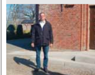
KIRKE Kirkeværge engagerer sig i sognet Læs side 5