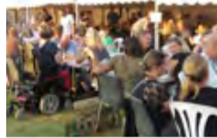
GANG I DIG OG DALBY Alt om Sommerfesten Læs side 4-8