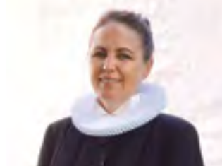
KIRKE Ditte tager over i tre måneder for sognepræst Læs side 3