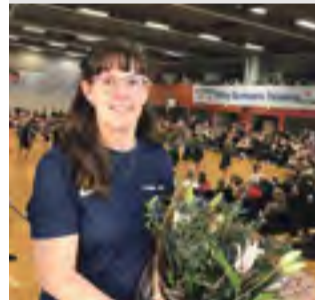
IDRÆT En ildsjæl takker af Læs side 9