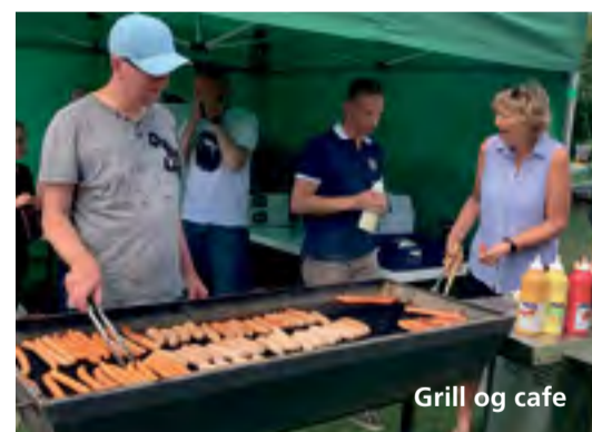
Grill og cafe