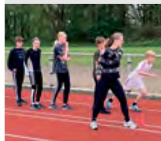
SKOLE 5.a vinder Skole OL Læs side 10