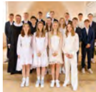
KIRKE Årets konfirmander Læs side 2