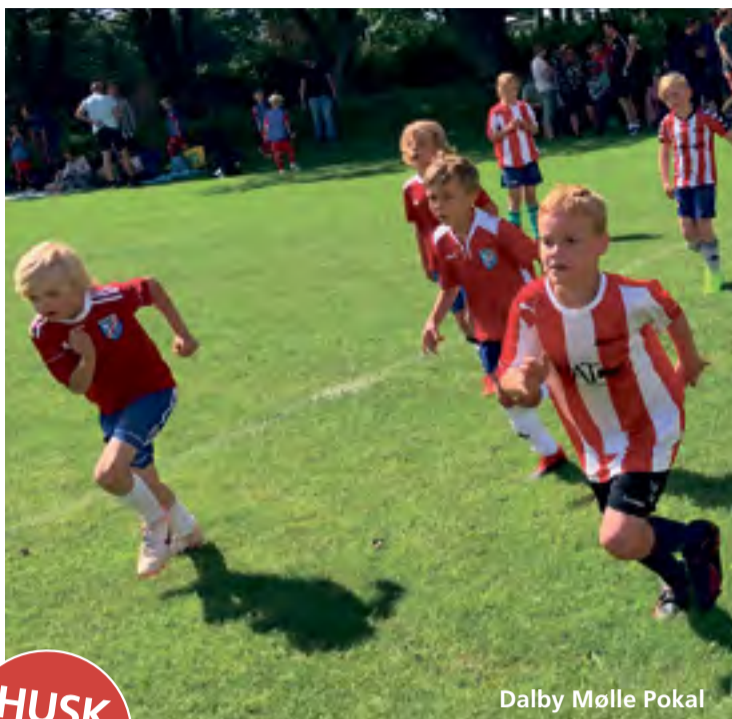
Dalby Mølle Pokal