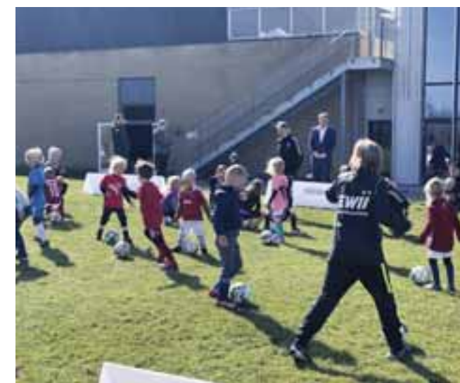
Børnene går op i spillet med liv og sjæl.