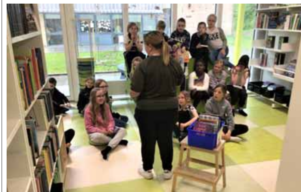
3C får introduceret gode bøger på PLC (skolebiblioteket).