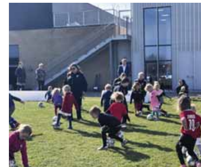
Der bliver både spillet kamp og øvet driblinger.