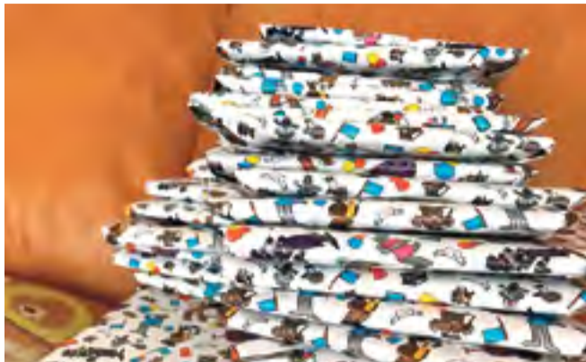
Købe pakker til børneboden: Tjek!