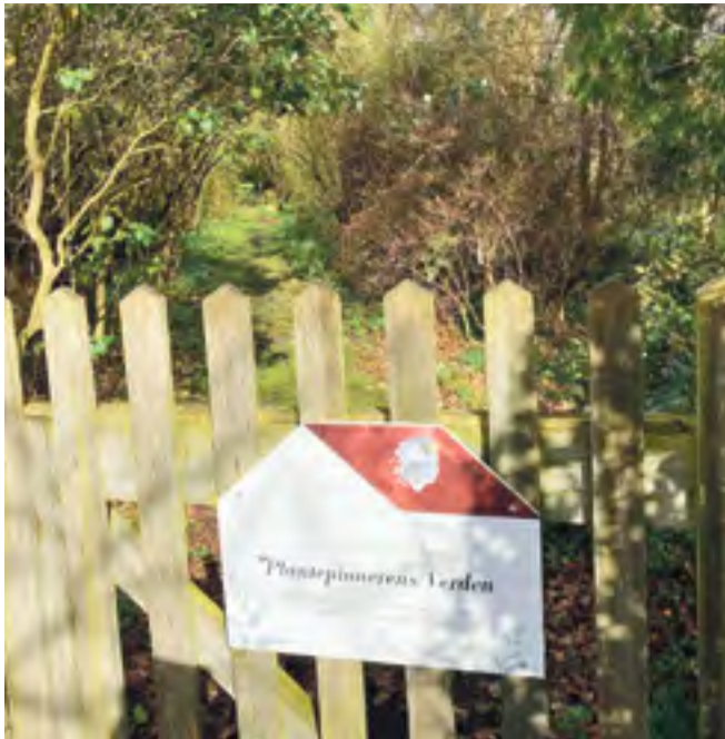
Det er ad stien bag dette skilt placeret på Geografisk Haves P-plads, at der er mødested tirsdag den 13. juni kl. 13.50. NB! Tilmelding.