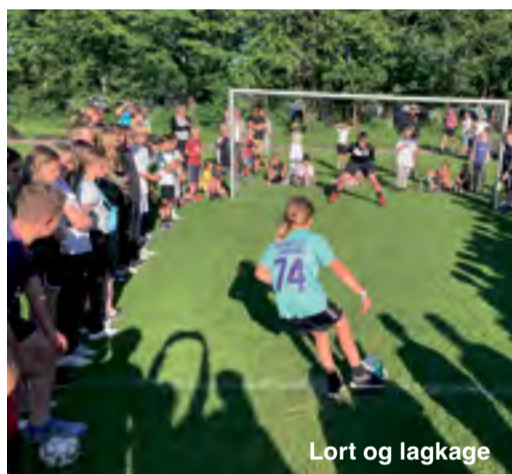
Lort og lagkage