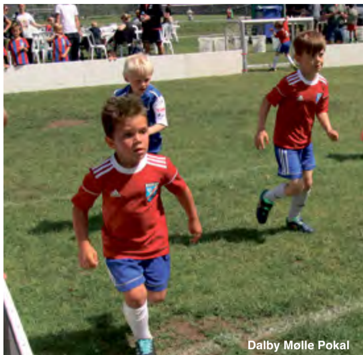
Dalby Mølle Pokal