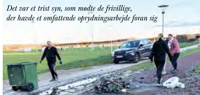
Det var et trist syn, som mødte de frivillige, der havde et omfattende oprydningsarbejde foran sig