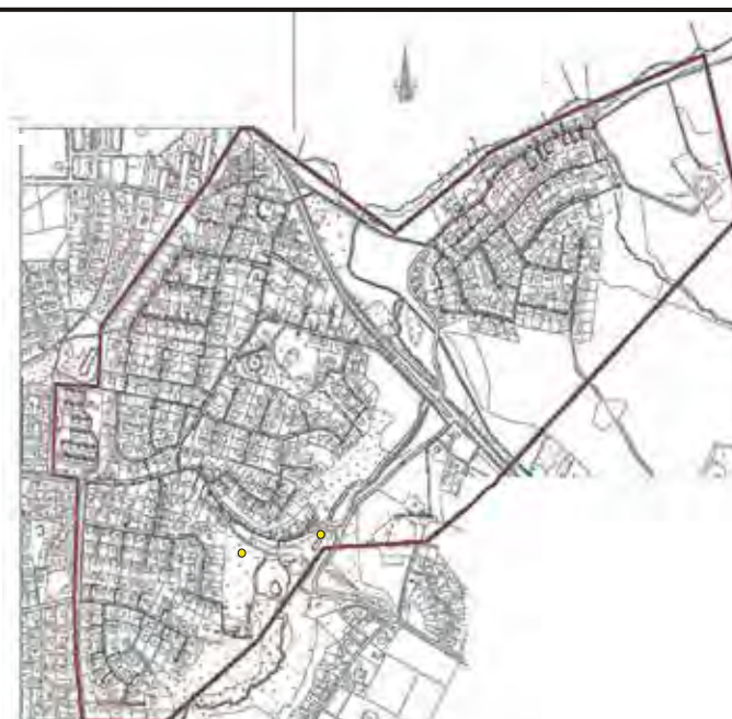
Tved Vands forsyningsområde

Husk: Målerbrønde og dæksler til stophaner må aldrig tildækkes.