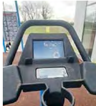
Selv fitnessbanens løbemaskiner er blevet ødelagt, og klubben skal nu bruge mange penge på nye.

Containerbranden den 1. januar er den mest alvorlige hændelse indtil videre. Her blev brandvæsen og politi tilkaldt af en beboer, der opdagede ilden. - Vi ser også unge opholde