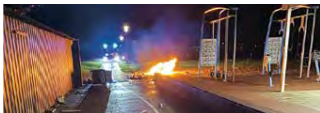
Brand og omfattende hærværk, der kulminerede den 1. januar, har ødelagt dele af løbebanen. Naboer var nødt til at tilkalde både politi og brandvæsen.