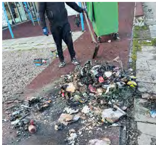
Brændt affald, knust glas og rester af nytårskrudt, der har brændt løbebanen, er med til at skabe utryghed i området.