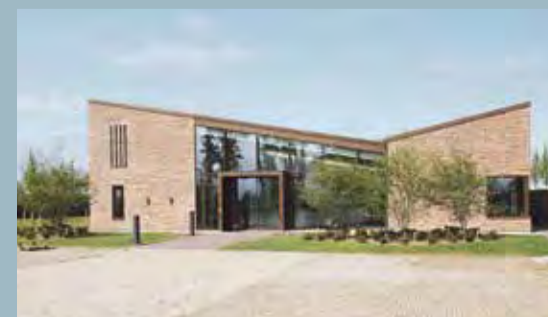
Traditionen med en nytårskirkefrokost begyndte tilbage i 1990'erne og er dermed gået ind i sit fjerde årti. I år dog for første gang i Sognehuset.

Kirkefrokosten, der afholdes i Sognehuset, er en dejlig anledning til god mad, hygge og sange fra højskolesangbogen.