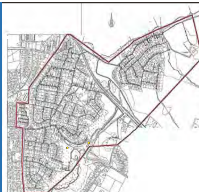
Tved Vands forsyningsområde

Husk: Målerbrønde og dæksler til stophaner må aldrig tildækkes.