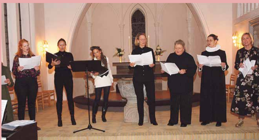
Kirkens kvindekor ved 150 års fødselsdagsgudstjenesten i oktober.