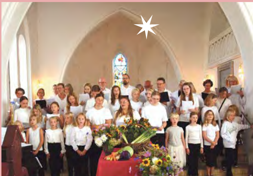
Børnekor, ungdomskor og voksenkor foran høstbord.