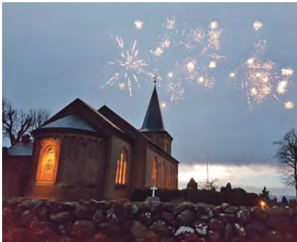
Den festlige nytårsaftengudstjeneste kl. 15.30 i Dalby Kirke afsluttes naturligvis igen i år med fyrværkeri.

Dalby Kirke onsdag 21. december kl. 19.00