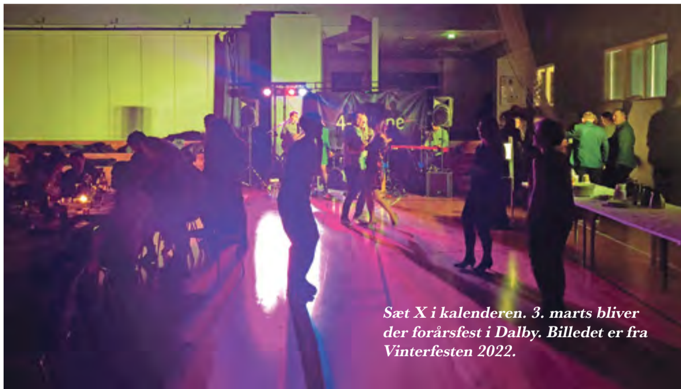
Sæt X i kalenderen. 3. marts bliver der forårsfest i Dalby. Billedet er fra Vinterfesten 2022.

Vi håber at se mange til festen, så vi kan dyrke og vedligeholde de gode sociale relationer i Dalby, Mariesminde, Tved, Rebæk og hele Goldbæk-området.