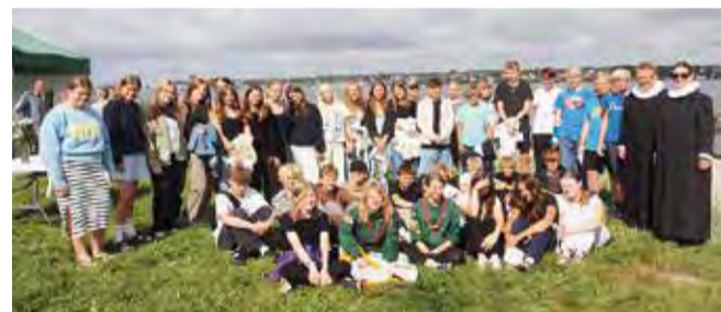
I fjor fik 38 konfirmander deres første "kryds" ved strandgudstjenesten.