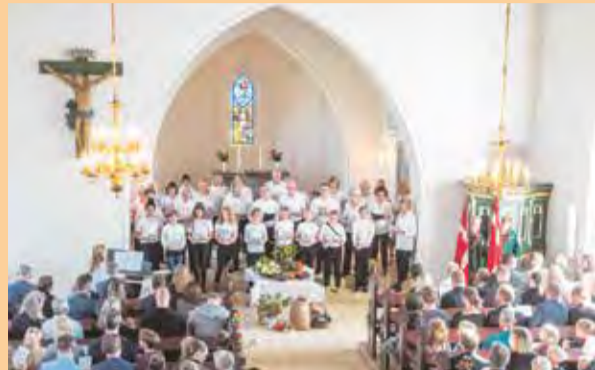
Kirkens ungdomskor og voksenkor medvirker også igen i en kirke, der er pyntet flot for at minde os om at dele Guds gode gaver med hinanden.

Høst er lig med fest og højtid i Dalby. Og alle kan begynde at glæde sig til traditionen med kirkefrokost i det fri efter familiegudstjenesten søndag 15. september kl. 10.30.