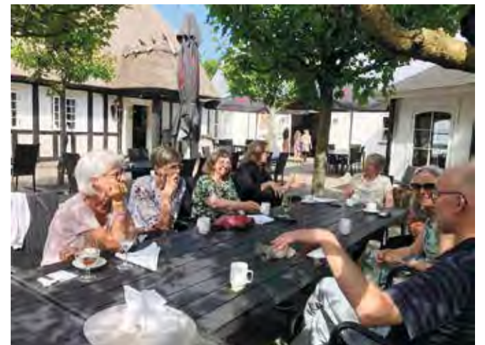
Frokost i strålende solskin på Den Gylden Hane.

Dagen gik med tur rundt på skolen, og derefter var der frokost på Den Gylden Hane.