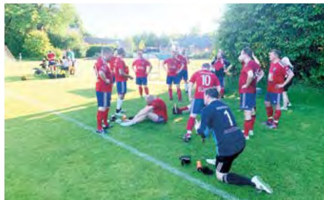
SOB-spillerne udnytter en hårdt tiltrængt timeout til at genvinde en basal lunge- og synsfunktion. Talens brug forsvinder mirakuløst nok aldrig.