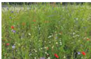
Et område blev tilsået med vilde blomster og græsser og blev til en blomstereng.