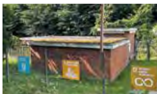
Stenurt (sedum) på taget er smukt og har masser af næring til insekter og sommerfugle

dede vi et hav af tidsler. Men begge planter får lov at være der i et begrænset omfang, for de har begge stor værdi for insekter og sommerfugle.