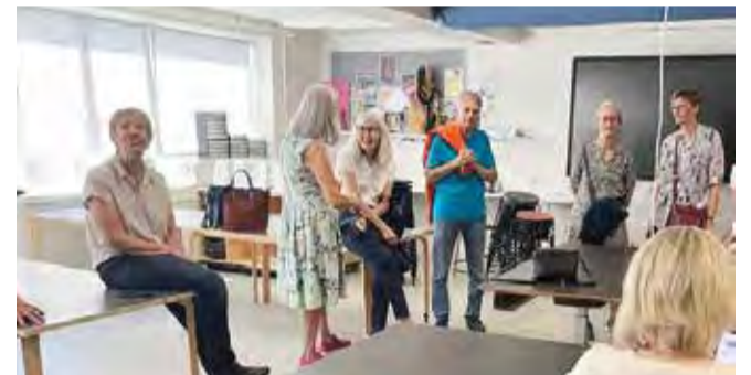
50 år gamle skoleminder blev genoplivet på Dalby Skole den 1. juni.