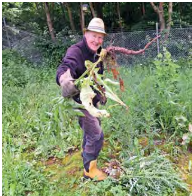
Tekstens forfatter i swing, for ikke alt vildt er lige velkomment.