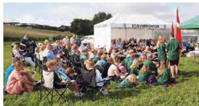
Medbring gerne klapstole eller tæpper.