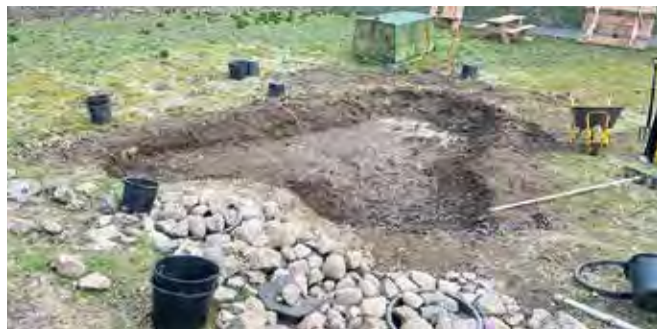
Et område med sten og vand har skabt levesteder for padder, krybdyr og meget mere.