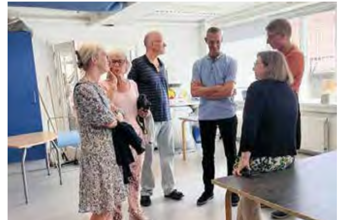
Klasselokalerne så ikke helt ud som for 50 år siden.