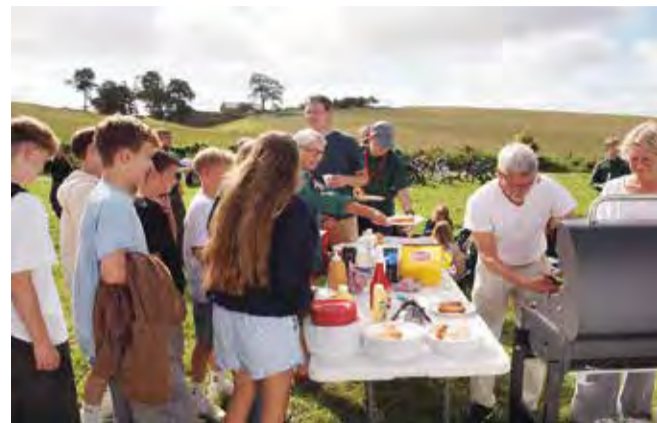
Ingen strandgudstjeneste uden grillpølser.

Selv om konfirmandforberedelsen ikke er begyndt endnu, er strandgudstjenesten en god anledning for årets konfirmander til at få begyndt at gå til gudstjeneste. Vi byder velkommen til dem, der dukker op.