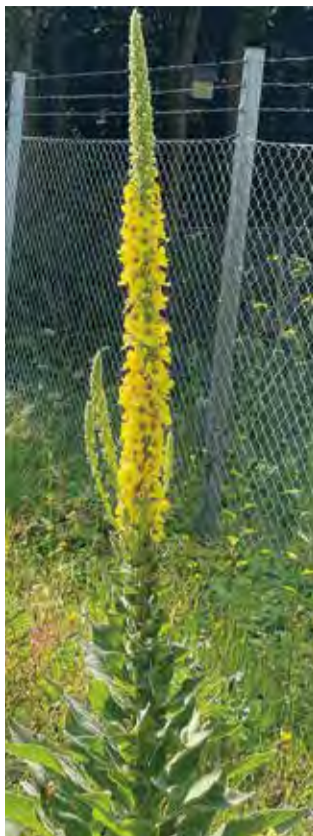
En af de flotteste planter er kongelys.

Det er ikke alle planter, vi er lige glade for. Sidste år ryddede vi godt op i gul engbrandbæger – den som er giftig for heste – og i år ryd-