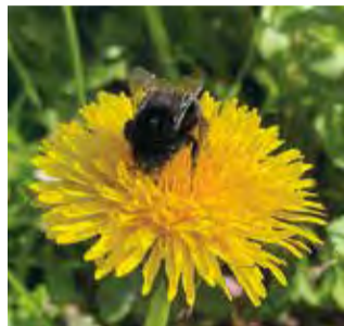
Flere hundrede påskeliljer druknede næsten i mælkebøtter, som bierne også foretrak.