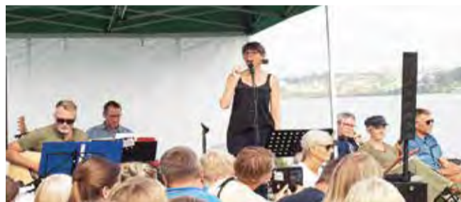
Spillemænd af Guds nåde er med igen i år.