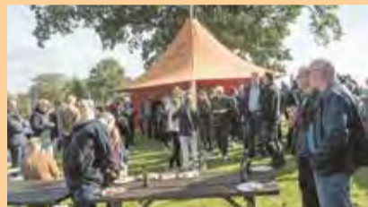
Spejderne har sat mastesejl op, så maden kan stå under dække. Og folk i sognet har bagt friskt brød til frokosten. Kr. 30,- pr. person + kr. 5,- for vand, kr. 10,- for ol. Alt går til det lokale spejderarbejde. MobilePay / kontant på dagen.