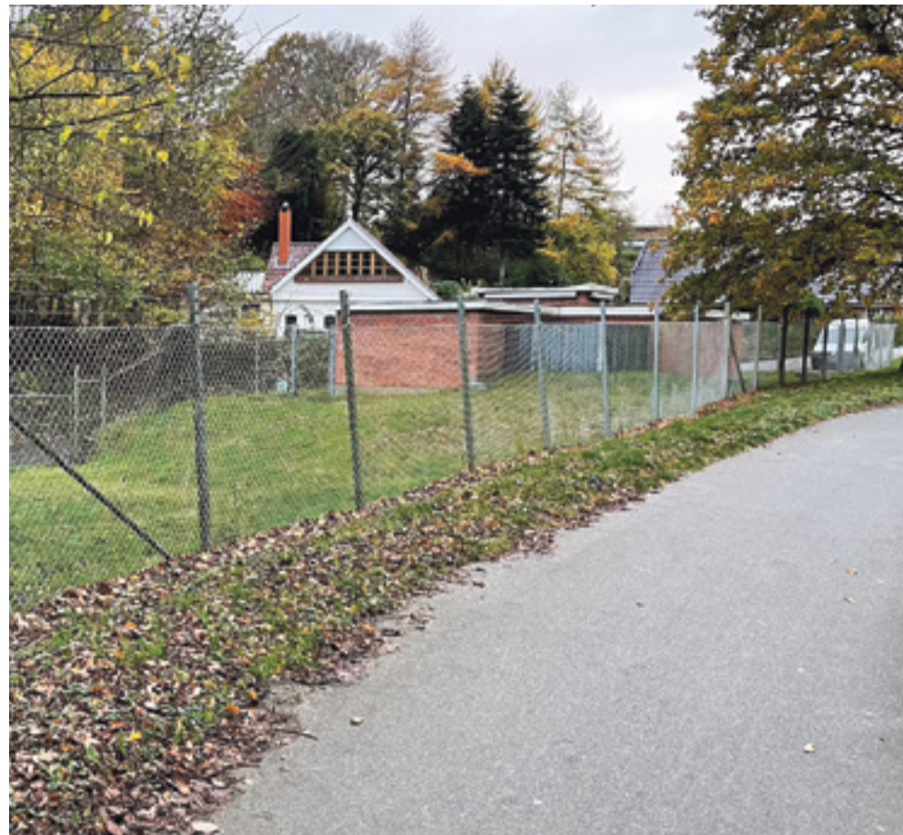
Tved Vandværk som det ser ud i dag. Hegnet slipper vi ikke for, men forhåbentlig bliver det mere spændende at stoppe op og kikke ind på det, der kommer til at ske på arealet.