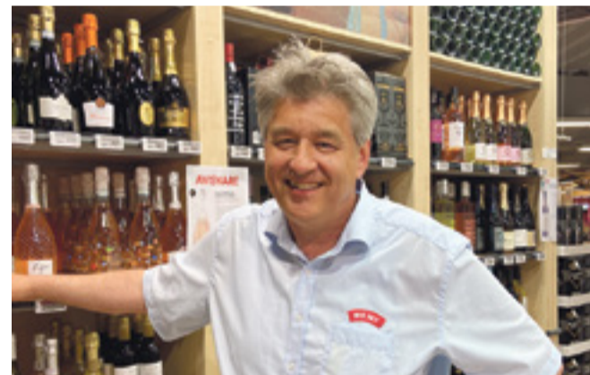
Der er allerede kommet mange nye vine på hylderne.