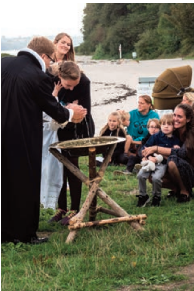
Også i år bliver der, sådan som vi har oplevet det tidligere, dåb ved strandgudstjenesten.

Selv om konfirmandforberedelsen ikke er begyndt endnu, er strandgudstjenesten en god anledning for årets konfirmander til at få begyndt at gå til gudstjeneste. Vi byder velkommen til dem, der dukker op.