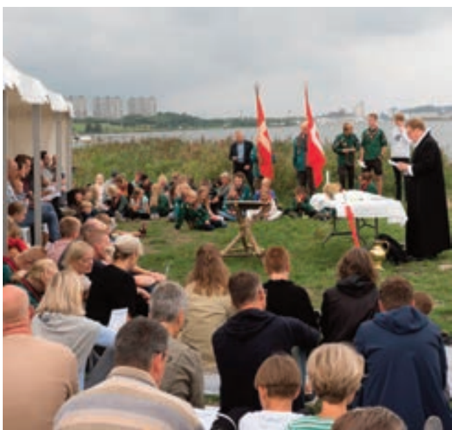
OBS! Medbring gerne klapstole eller tæpper. Kirken har langt fra klapstole til alle.

Med spillemænd, landbrugsmaskiner og kirkefrokost Mere i næste nr. af Dalby Tidende