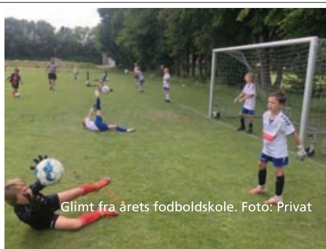
Glimt fra årets fodboldskole.

Til efteråret kommer Morten igen til at få hele forskningsdage, så hverdagen bliver mere fleksibel. Og så bliver der igen tid til at spille lidt Oldboys fodbold i Dalby.