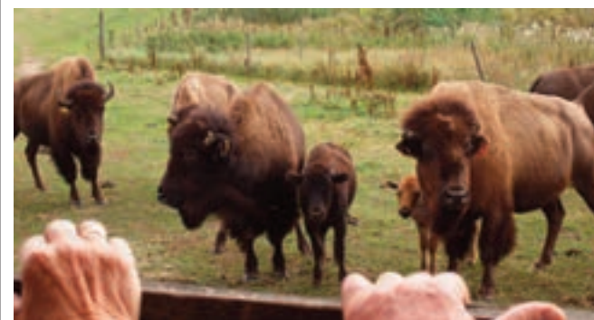
Årets sogneudflugt spænder vidt – lige fra kunst på Kunstgården til frokost og rundtur på Ditlevsdal Bisonfarm i åben hestevogn, hvor man kommer helt tæt på bisonokserne.