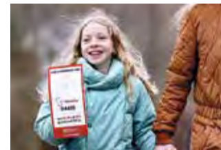
Ved årets Sogneindsamling samlede Dalby over 29.000 kr. ind til Folkekirkens Nødhjælps store arbejde blandt folk, der er ramt af krig og klimaforandringer.

Som et nyt initiativ i anledning af Sogneindsamlingen gav Dalby Kirkes Ungdomskor støttekoncert torsdag 7. marts. Koncerten bidrog med 1.815 kr. til det samlede Dalby-resultat.