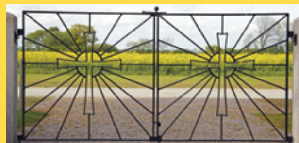
Påsken er smukt markeret i lågerne ind til Dalby Kirke med solens stråler, der sprænger korset, så lågerne på den måde illustrerer livets sejr over døden.

Det bliver stort og festligt, når vi på kristendommens største festdag skal fejre, at lyset banede sig vej ned i mørket og fordrev det, så det ikke er livet, der ender med død, men døden, der ender med liv.