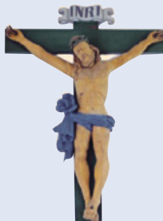
Krucifikset fra Dalby Kirke stammer fra omkring år 1500.