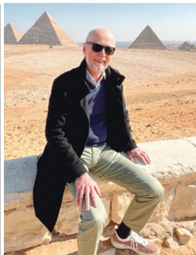
SAT-7 har studier i Egypten, Libanon og Tyrkiet og har fået stor opbakning i "den arabiske gade".