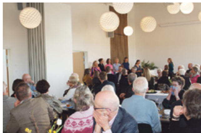
Dalby Kirkes kvindekor – i baggrunden – begejstrede de mange fremmødte ved indvielsen med både festlige og bevægende sange.