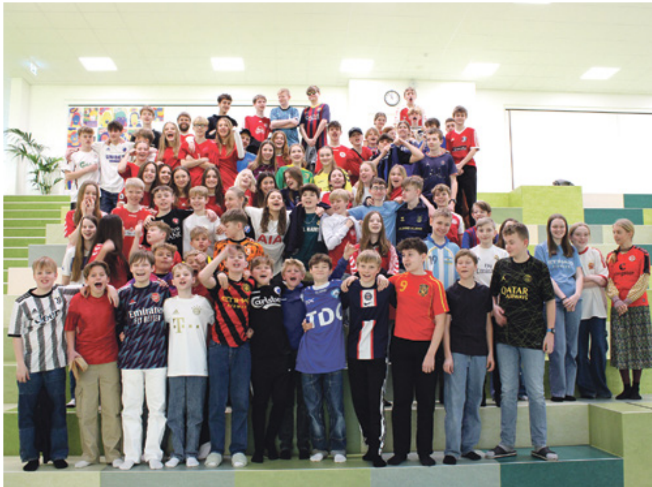
For første gang blev Dalby Skole ramt af fænomenet FodboldtrøjeFredag, der støtter Børnecancerfonden. Her ses alle de udskolings elever, der havde benyttet anledningen til at tage en fodboldtrøje på fredag den 3. marts.

Søndag 7. kl. 10.30 Konfirmation den gamle C-klasse