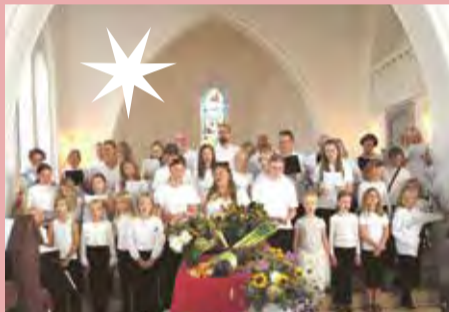
Børnekor, ungdomskor og voksenkor.

Babyrytmik er en musikalsk oplevelse, hvor vi med nye og gamle børnesange, salmer, dans, bevægelse, leg og enkle rekvisitter sammen skaber et rum med nærvær og fællesskab, der stimulerer barnets sanser og udvikling. Lektionen varer 45 minutter, og der er kaffe / brød og tid til amning, bleskift og hygge bagefter. Det er gratis at deltage.