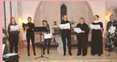
Kvindekor ved kirkens 150-års fødselsdagsgudstjeneste.