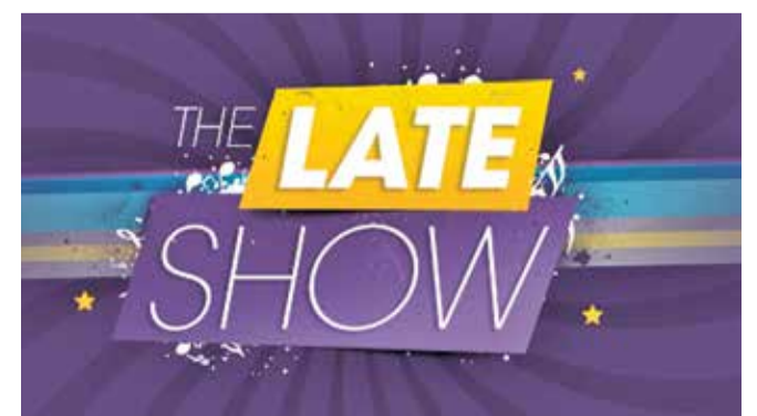
Det lokale band The Late Show får selskab af Jimmy Bacoll, når de tænder op under Forårsfesten.