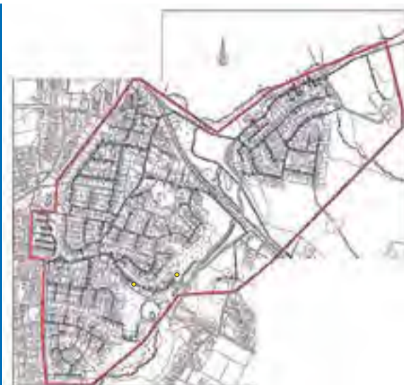
Tved Vands forsyningsområde