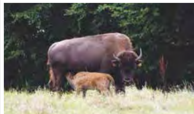
Er vi heldige, får vi måske et glimt af en af Ditlevdales mere stiftfærdige hverdagssituationer.

Efter rundvisningen er der mulighed for et kort besøg i gårdbutikken.