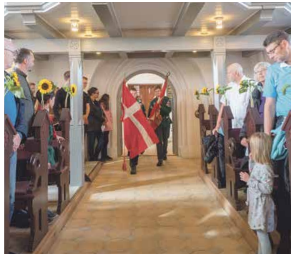
De lokale KFUM-spejdere fra Mariemindel deltager som altid i høstgudstjenesten med faner.