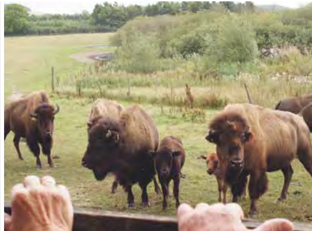
Årets sogneudflugt spænder fra kunst på Kunstgården til rundtur i åben hestevogn, hvor man kommer helt tæt på bisonokserne på Ditlevsdal Bisonfarm.

www.dalbykirke.dk Se kirkens hjemmeside for sidste nyt.