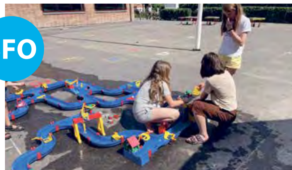
Vandbanen: SFO'en havde sat en lang vandbane op i skolegården, som børnene havde stor fornøjelse af.