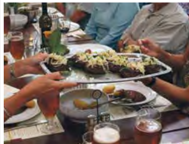
Vi skal selvfølgelig have husets specialitet til frokosten på Ditlevsdal Bisonfarm, nemlig hakkebøffer lavet af kød fra egen bisonavl.

Bison: Frokost og rundvisning Første program punkt er frokost på Ditlevsdal Bisonfarm, der serverer ste-