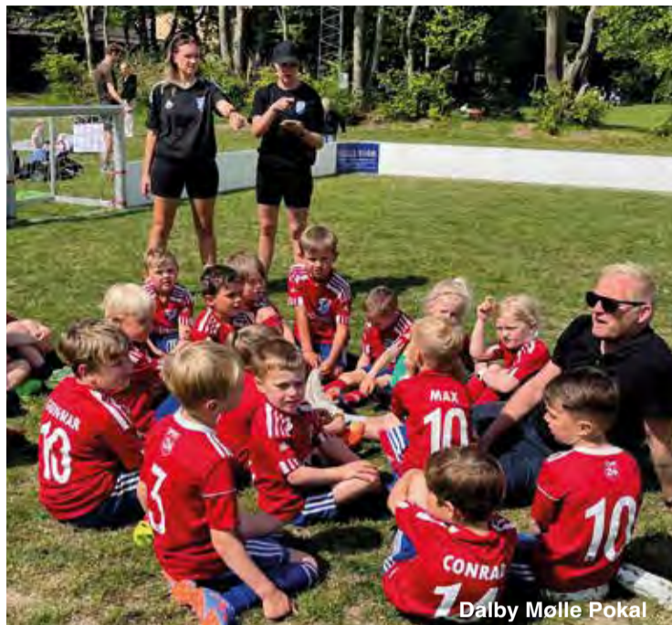
Dalby Mølle Pokal