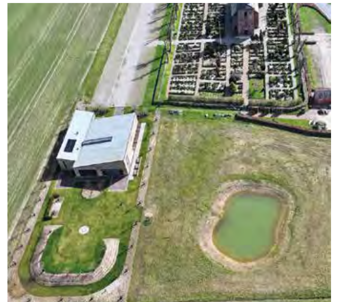
Det er Sognehusets have nederst til venstre i billedet – her i sin lidt matte "tidlig-april-drugt" – der 23. juni danner rammen om den første Sankthansfest ved Dalby Kirke og Sognehus.

Cross Yoga er gratis. Alle er velkomne. Tilmelding til: LETH@km.dk NB! Husk yogamatte.