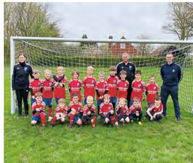
Fototekst: Glade U7 drenge med nyt tøj fra Rema1000 i Agtrup Bjert.

Takket være et meget gavmildt sponsorat fra Rema1000 i Agtrup Bjert har Dalbys U7 drenge fået nye flotte spillersæt med eget navn og nummer på ryggen. Drengene har med stor glæde taget det nye tøj i brug og er nu helt klar til, at spille kampe og stævner i løbet af foråret og sommeren.