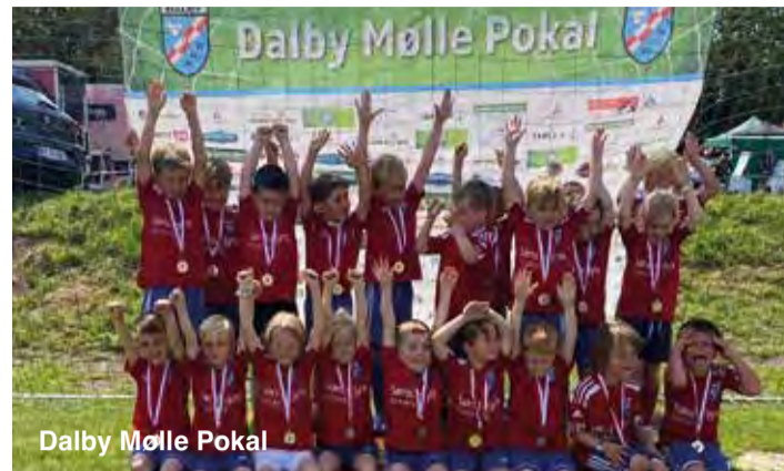
Dalby Mølle Pokal